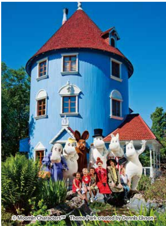
▲ムーミンのテーマパーク「ムーミンワールド」

© Moomin Characters™ Theme Park created by Dennis Livson