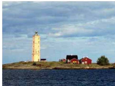
▲「ムーミンババ海へ行く」の舞台といわれるソーダーシャールの灯台

ムーミン・キャラクターズ社は世界的な人気者ムーミンを守り支えている会社。ふだんは一般の方が立ち入ることのないこの場所へ皆様を特別にご招待！ムーミングッズが誕生した1950年代からの貴重なものから、現在販売されているものまで、世界じゅうのムーミングッズが展示されているオフィスは圧巻です。