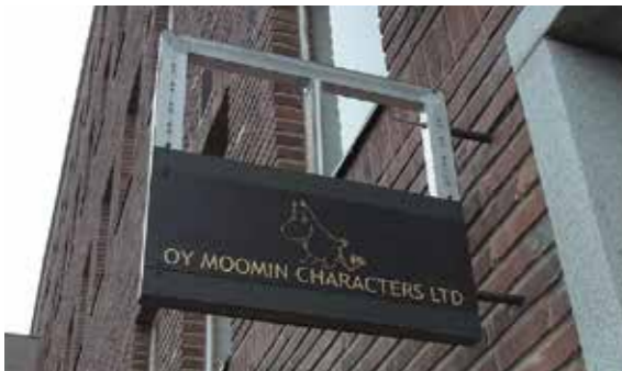
▼ムーミン・キャラクターズ社オフィス

ムーミン・キャラクターズ社は世界的な人気者ムーミンを守り支えている会社。ふだんは一般の方が立ち入ることのないこの場所へ皆様を特別にご招待！ムーミングッズが誕生した1950年代からの貴重なものから、現在販売されているものまで、世界じゅうのムーミングッズが展示されているオフィスは圧巻です。