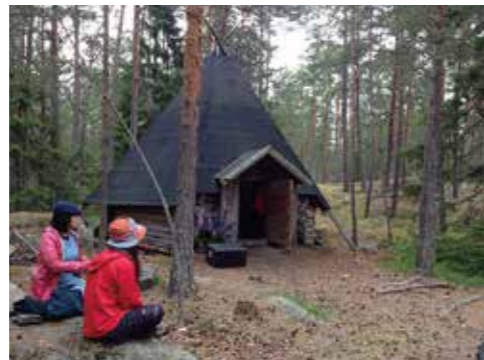
▲フィンランドの森で、ムーミンの世界を感じる体験を